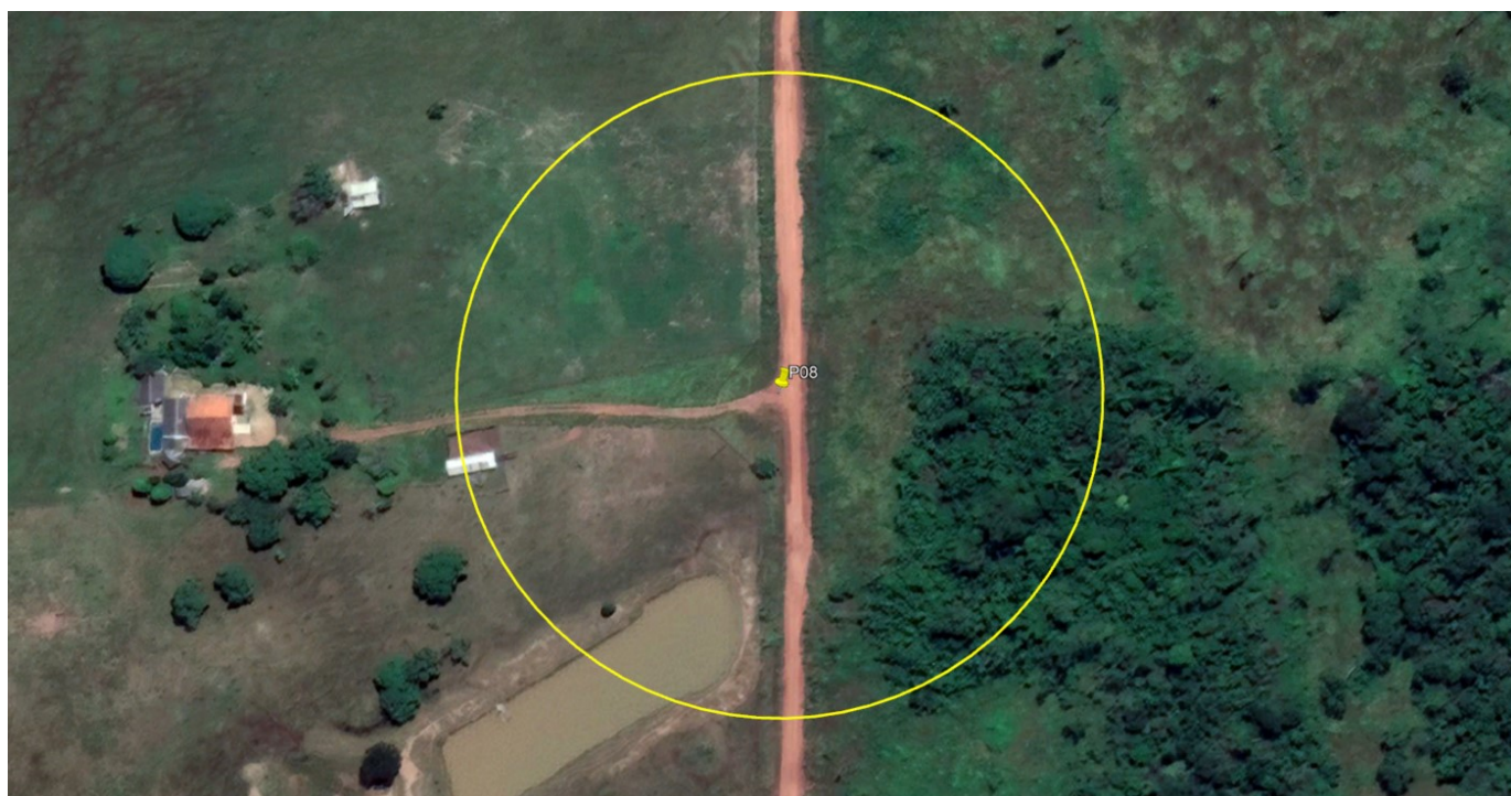
P08 – ENTRADA FAZENDA