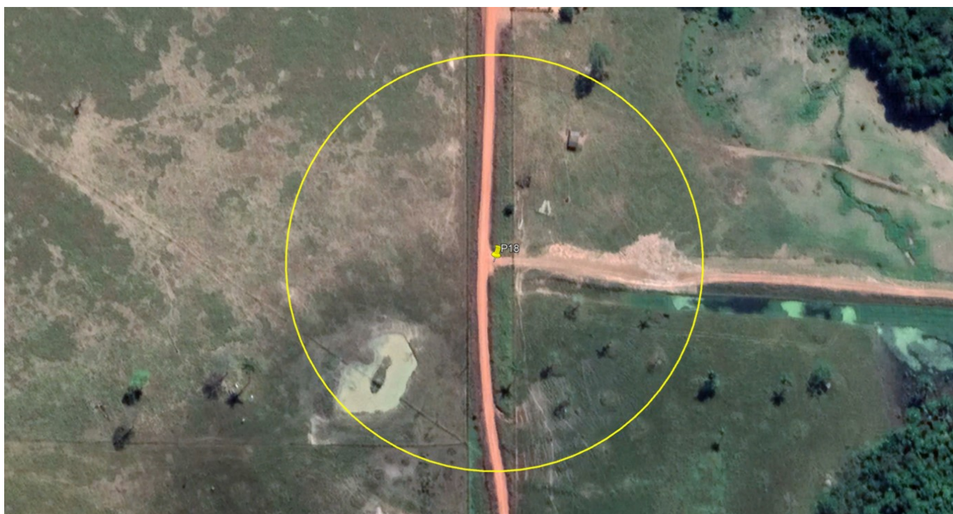
P18 – ENTRADA FAZENDA