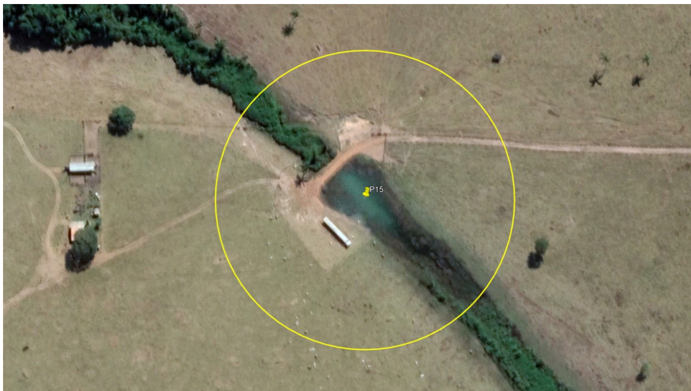
P15 – LAGO