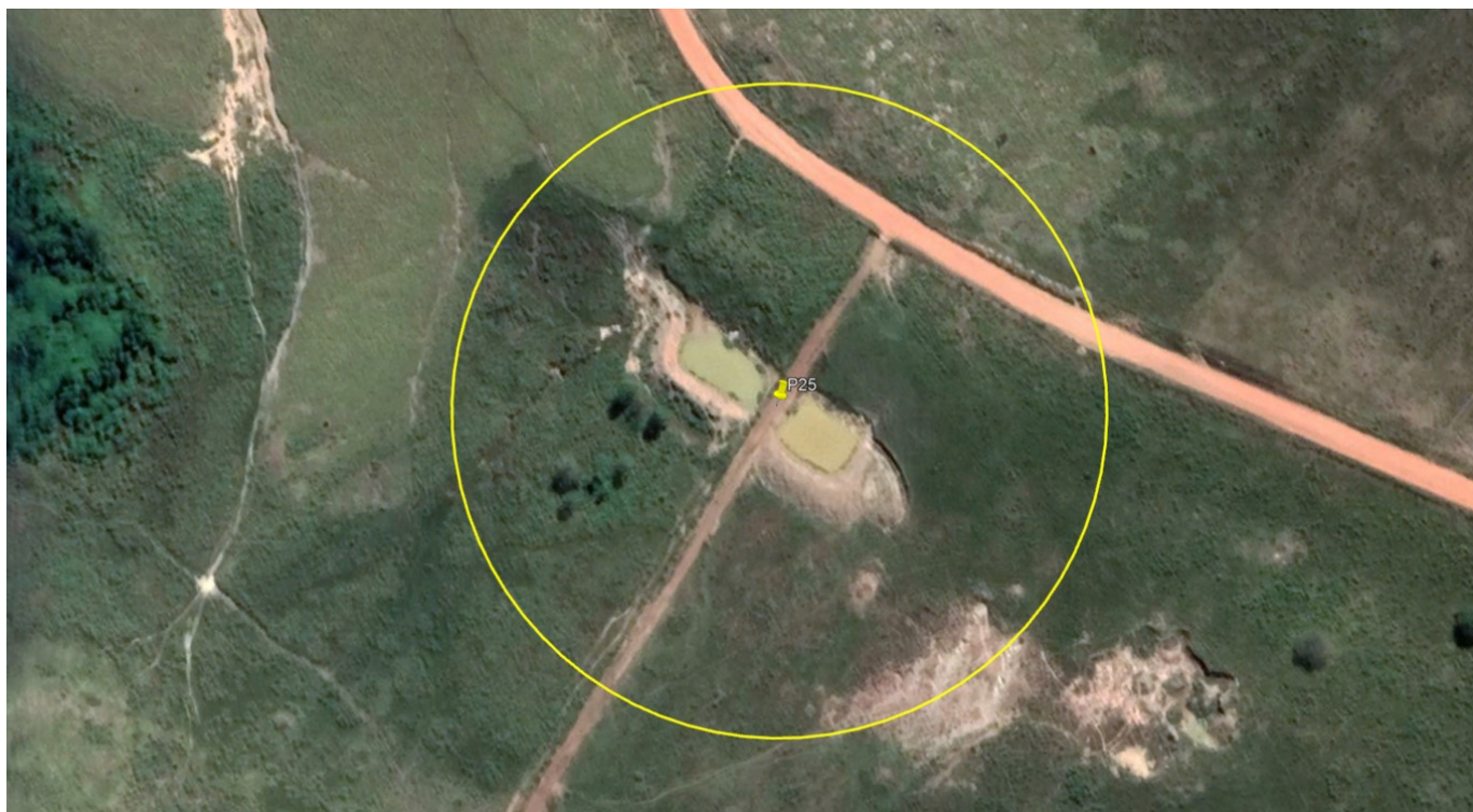
P25 – ENTRE AÇUDES