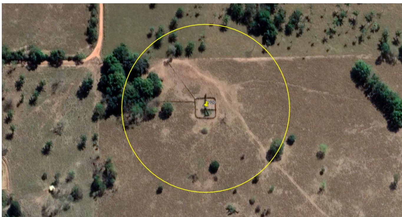
P20 – CURRAL