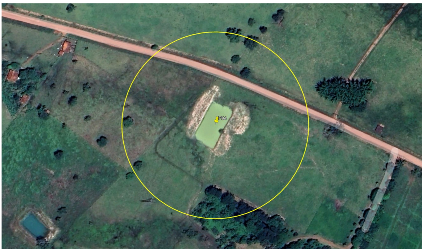
P04 – AÇUDE