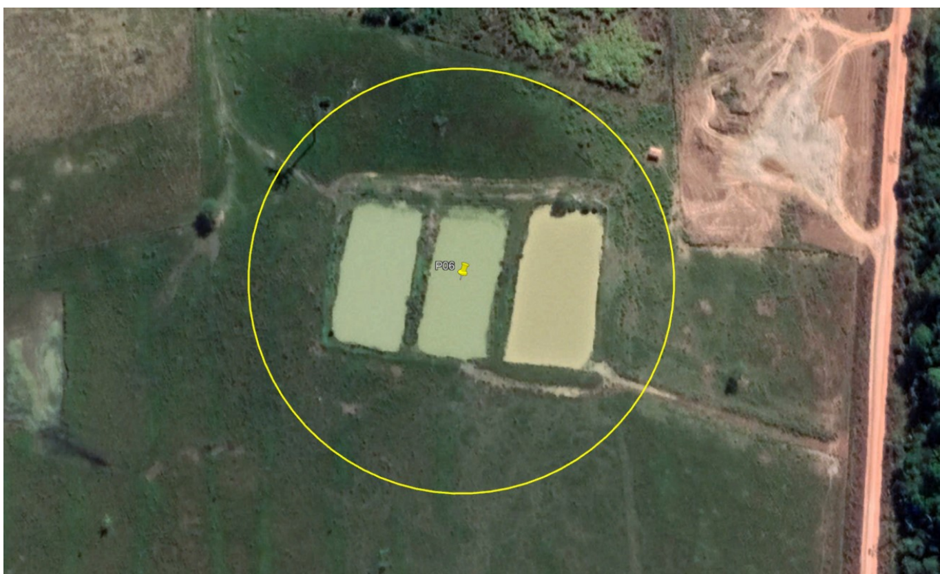
P06 – AÇUDES