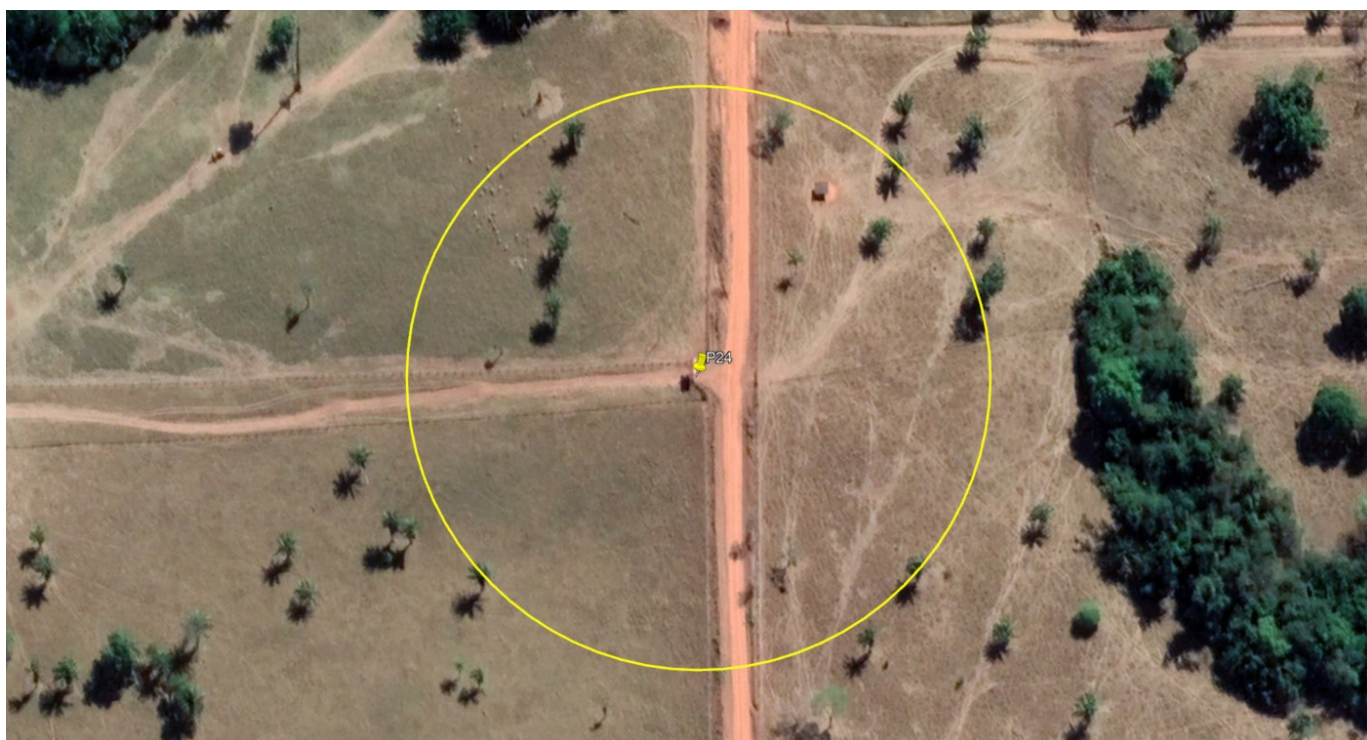
P24 – ENTRADA FAZENDA