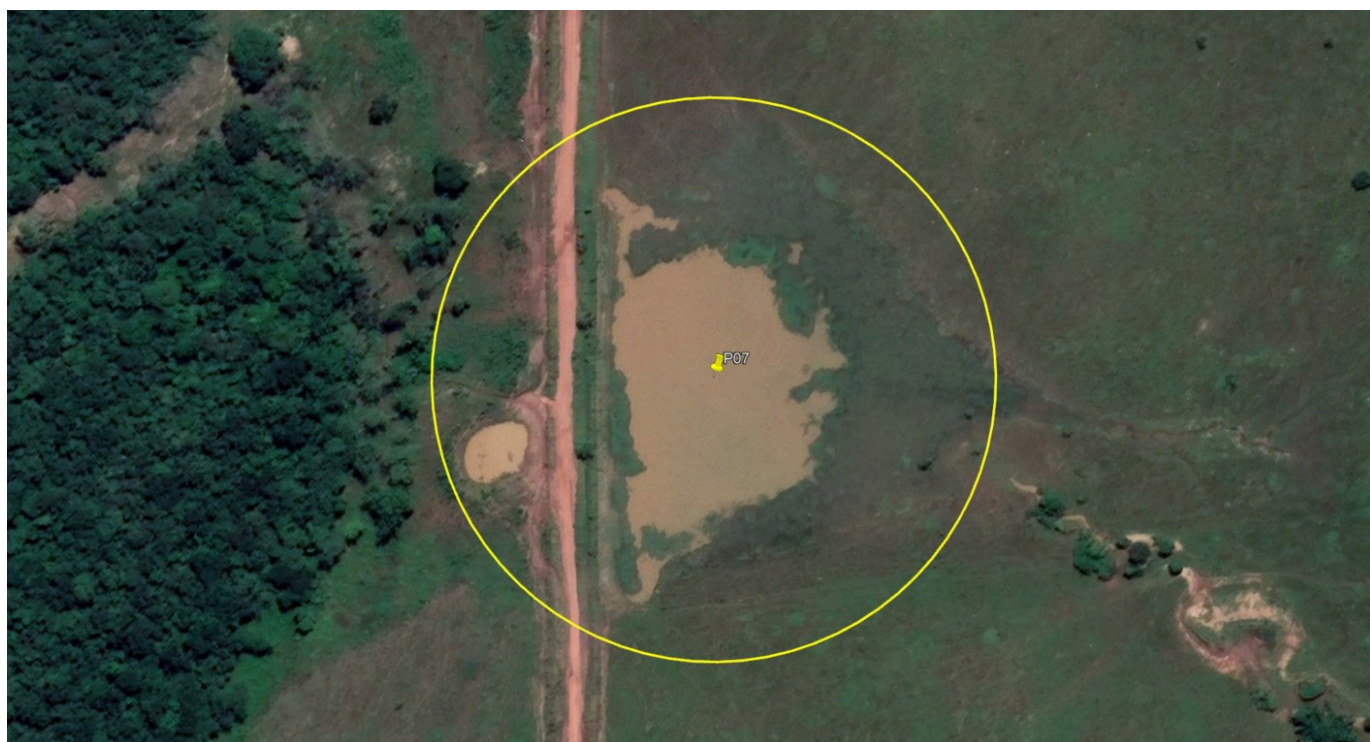
P07 – LAGO