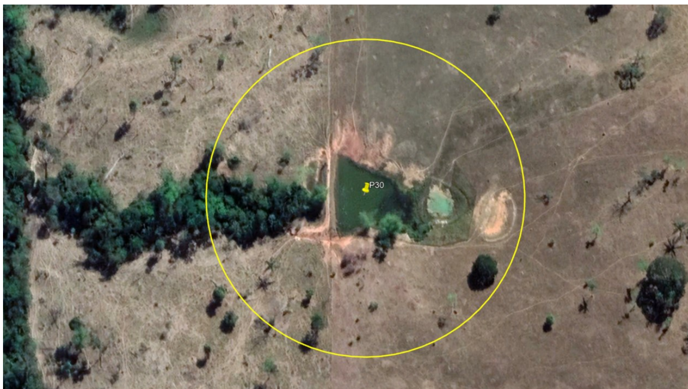
P30 – LAGO