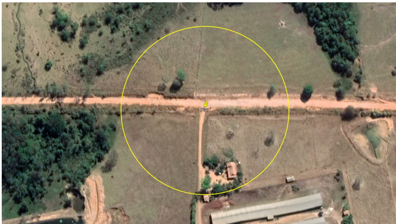
P31 – ENTRADA AVIÁRIO