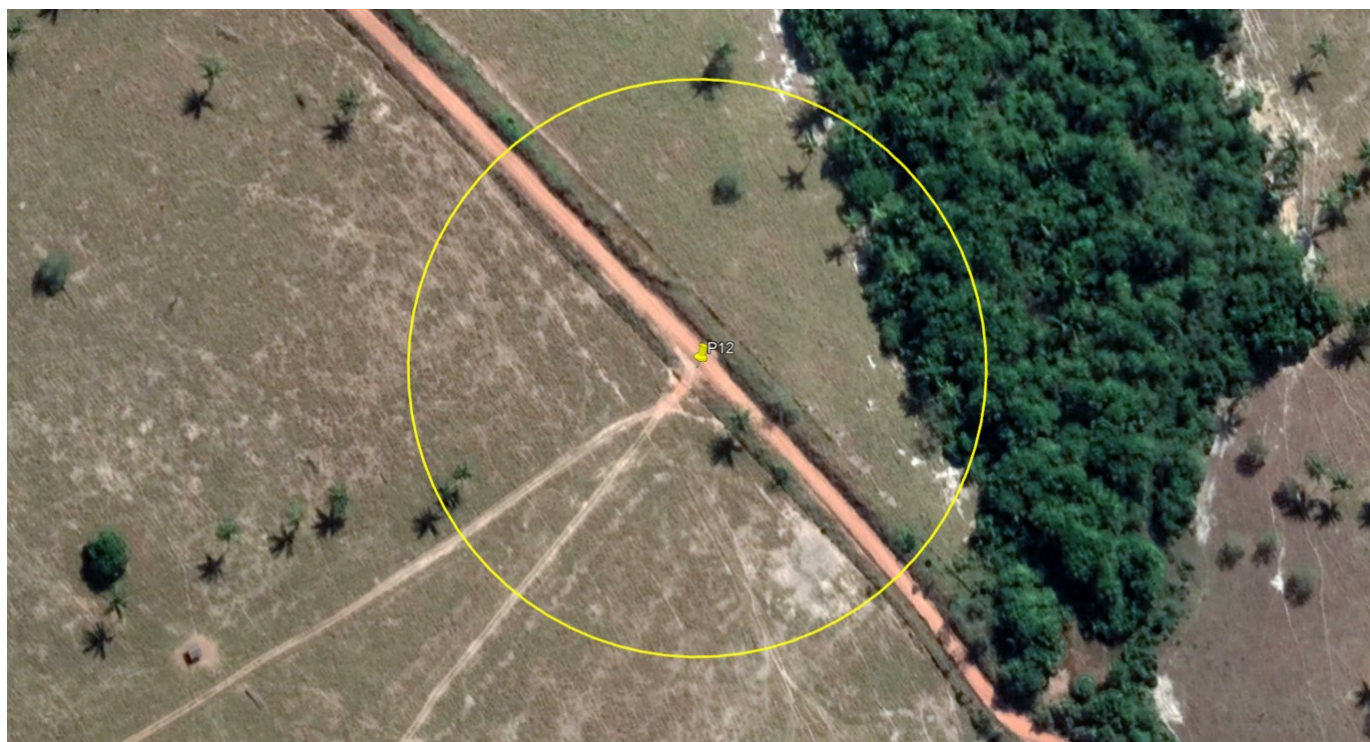
P12 – ENTRADA FAZENDA