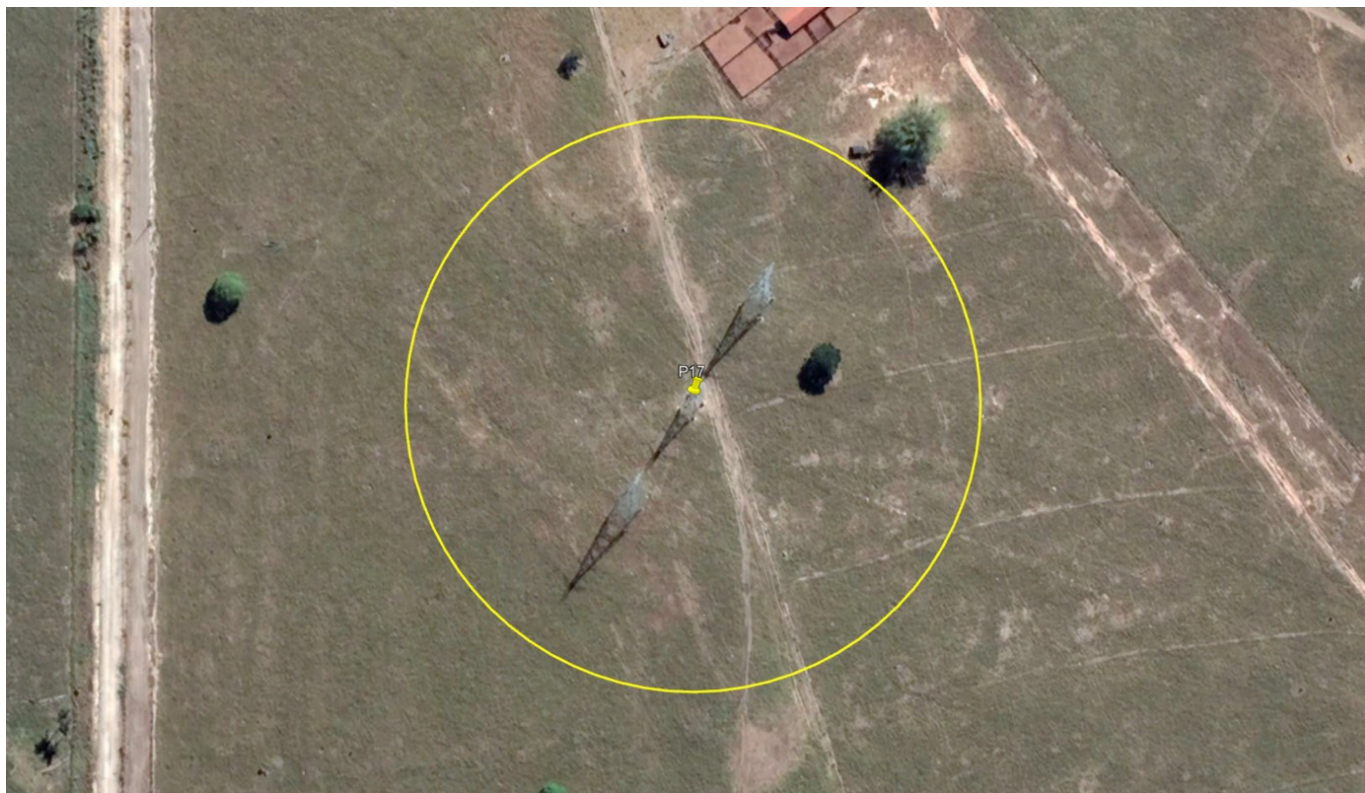
P17 – TORRE ALTA TENSÃO