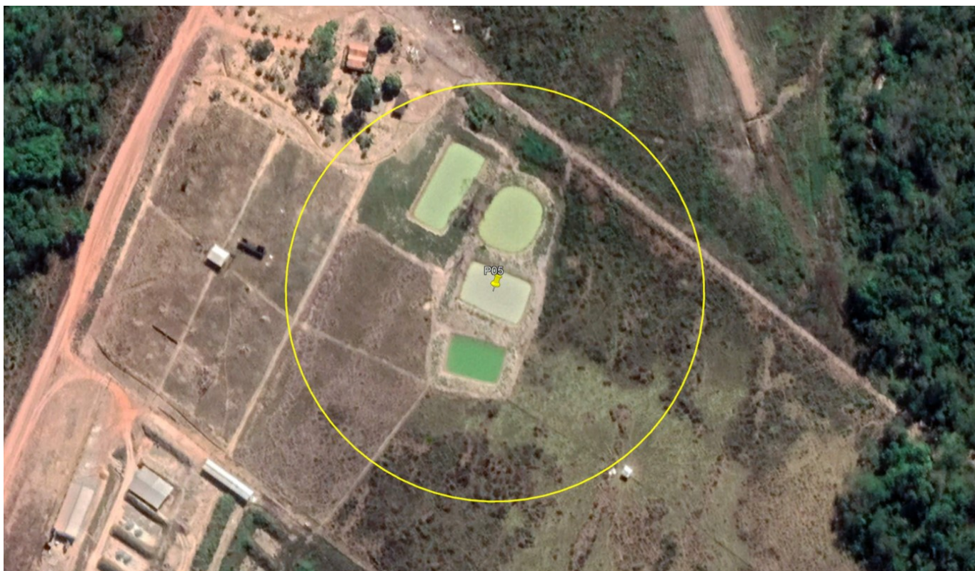
P05 – AÇUDES