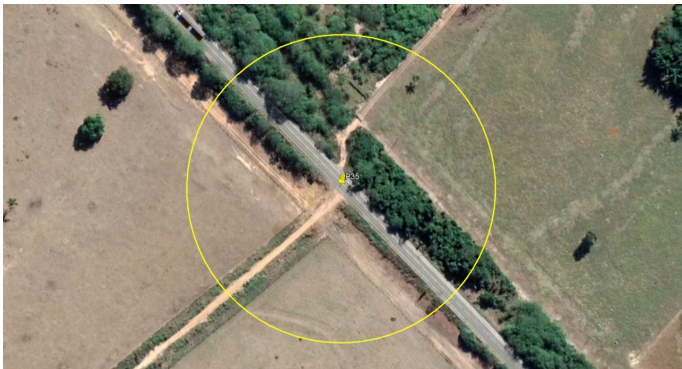
P35 – CRUZAMENTO