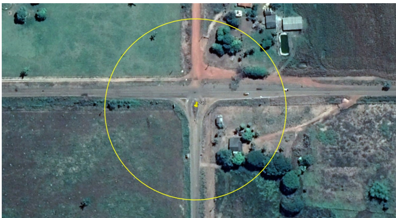
P40 - CRUZAMENTO