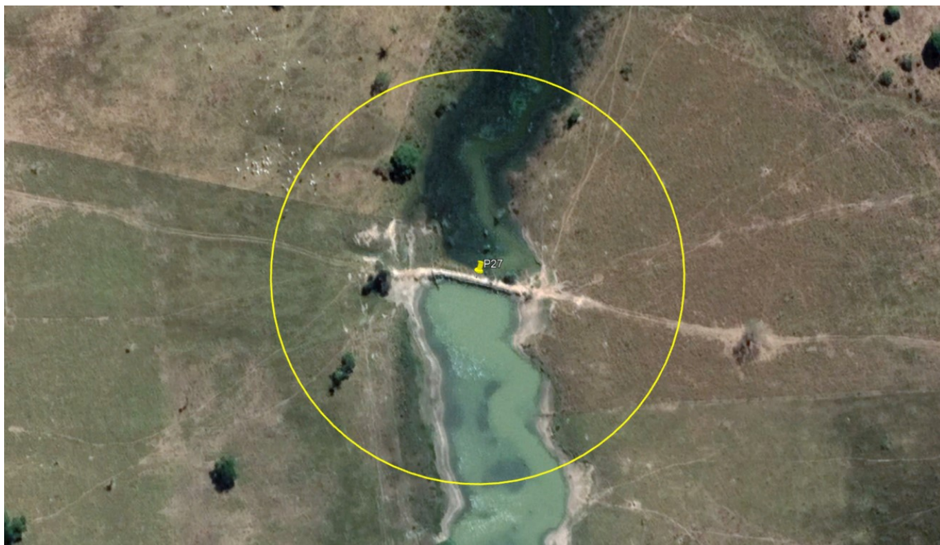
P27 – LAGOS