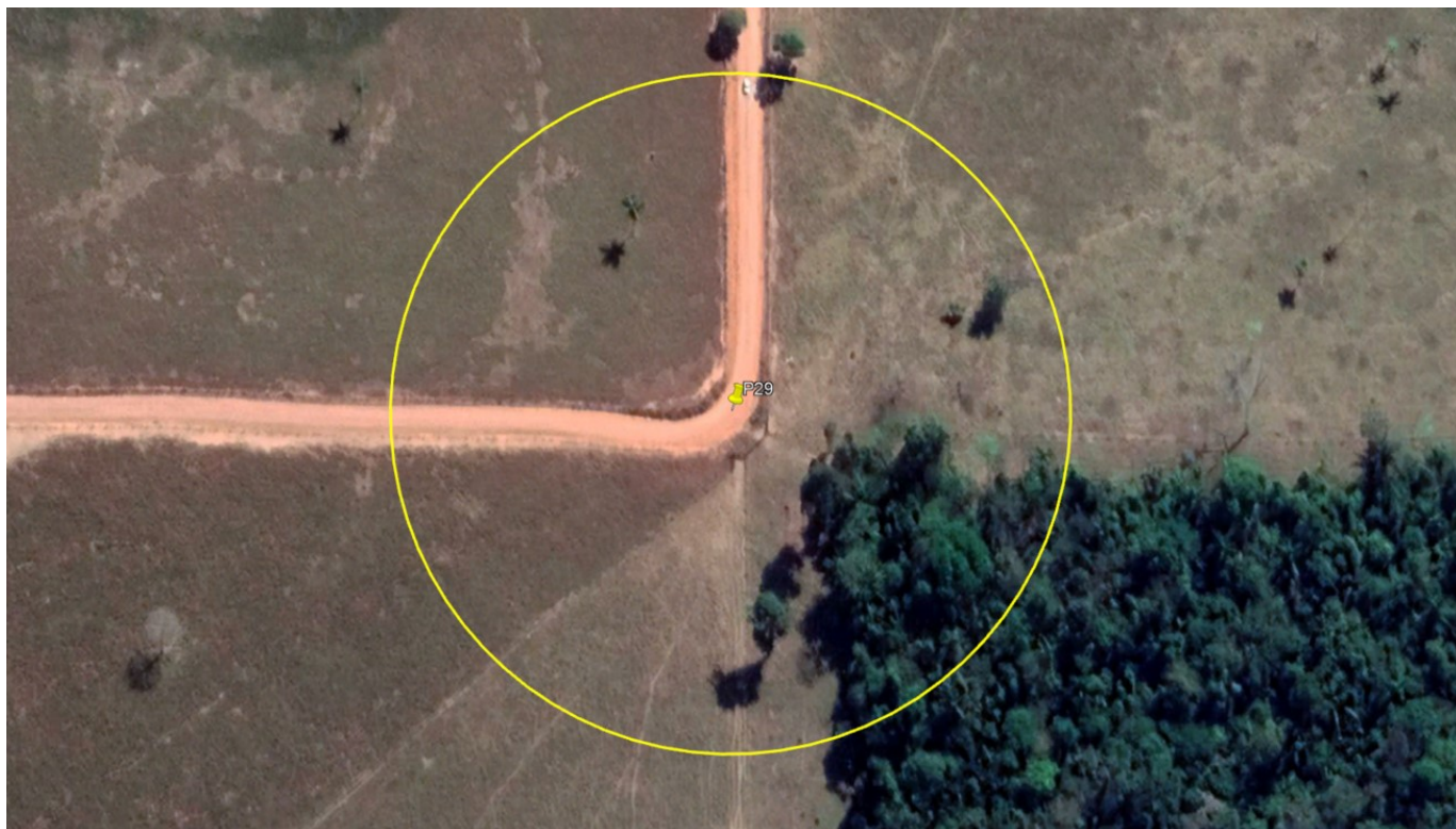
P29 – CURVA