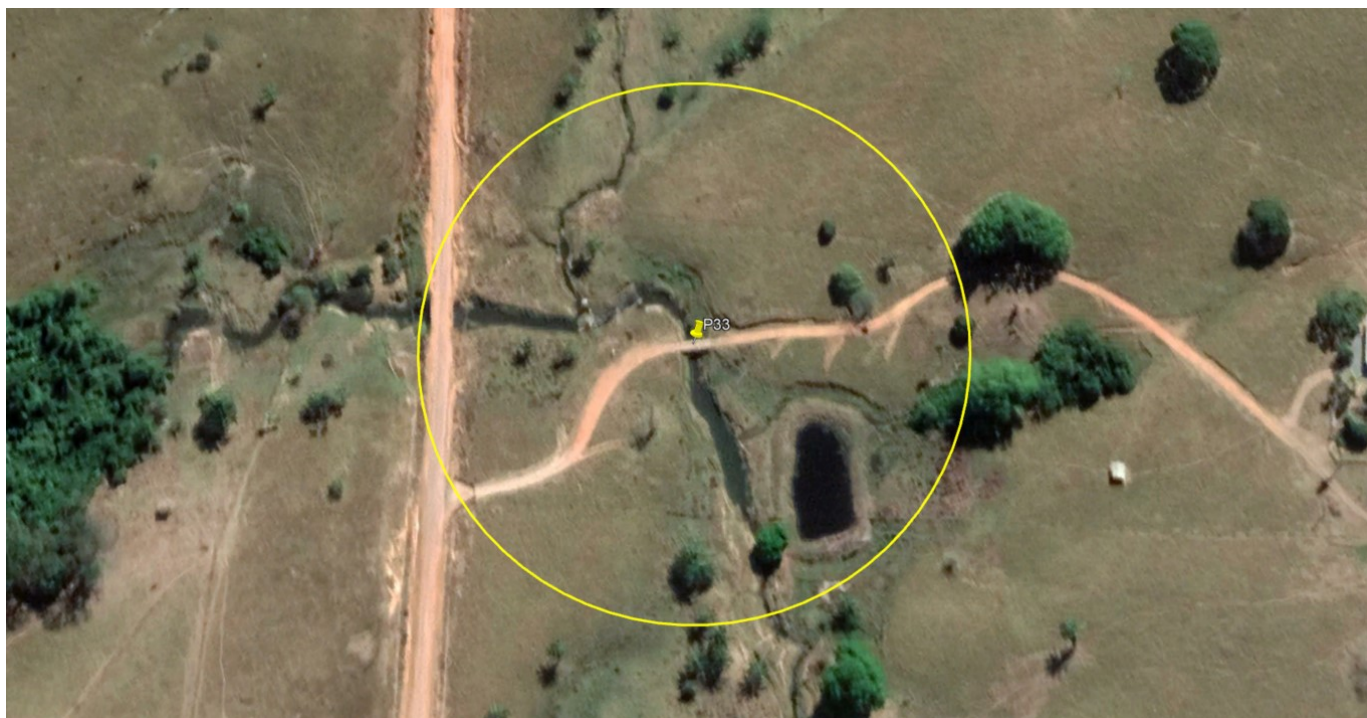
P33 – PONTE