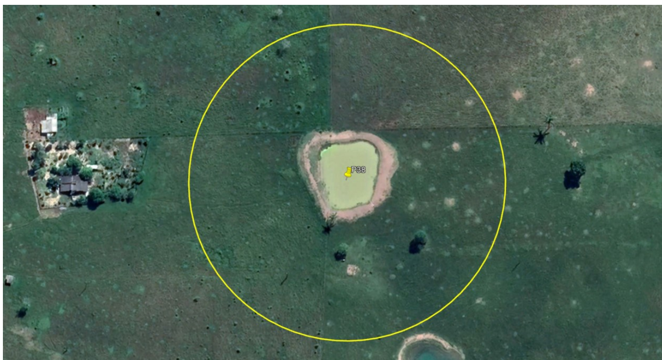
P38 – LAGO