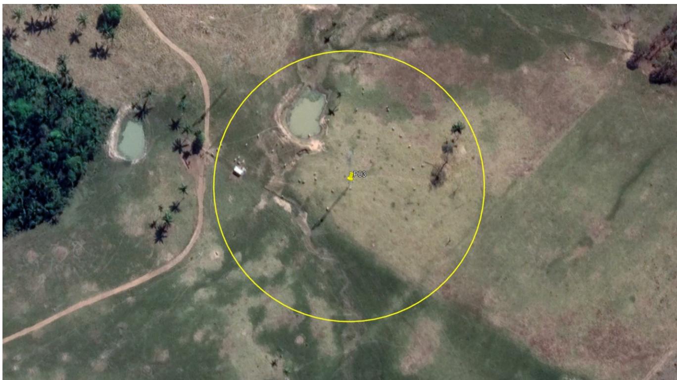
P03 – TORRE ALTA TENSÃO