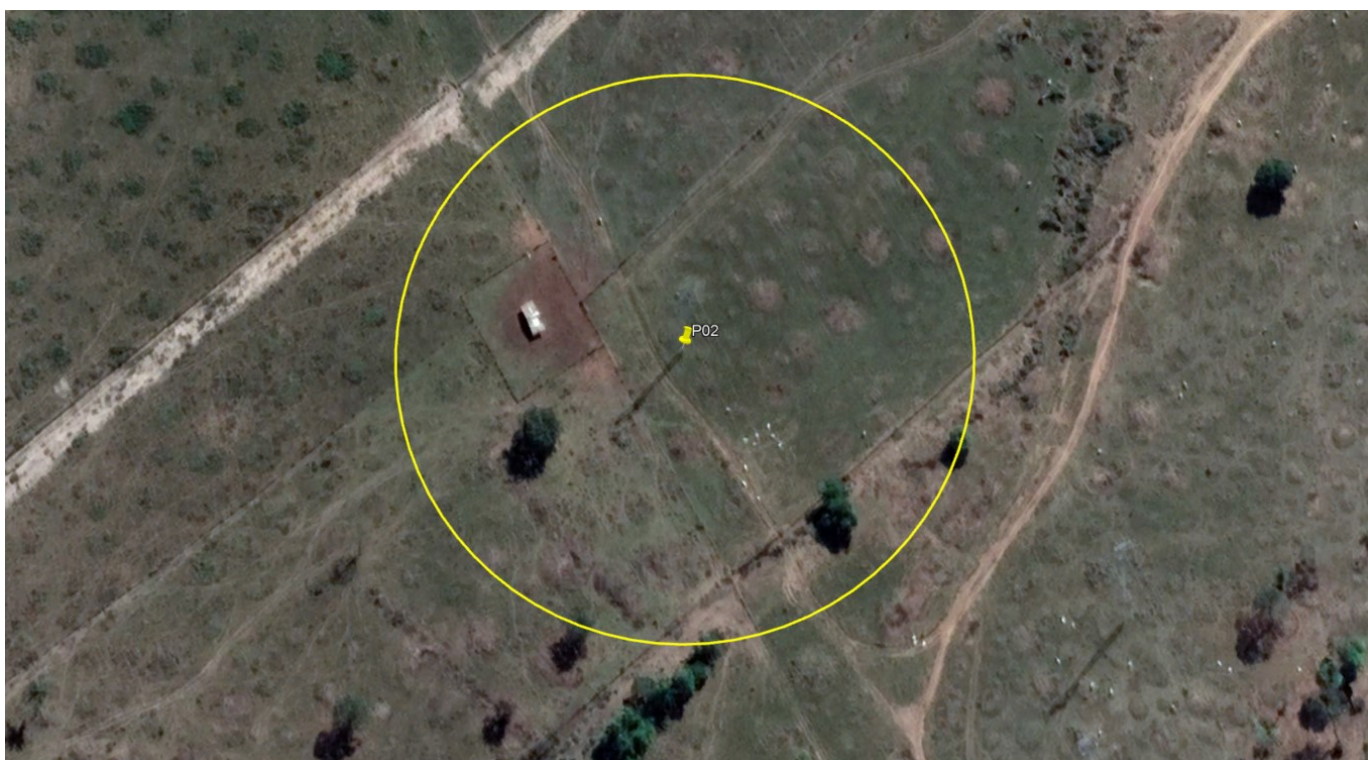
P02 – TORRE DE ALTA TENSÃO