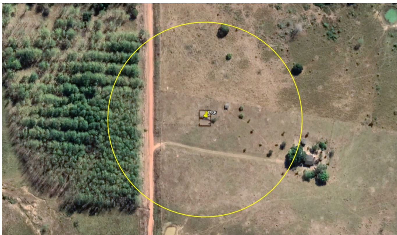
P36 – CURRAL