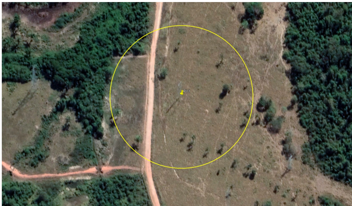
P11 – TORRE ALTA TENSÃO