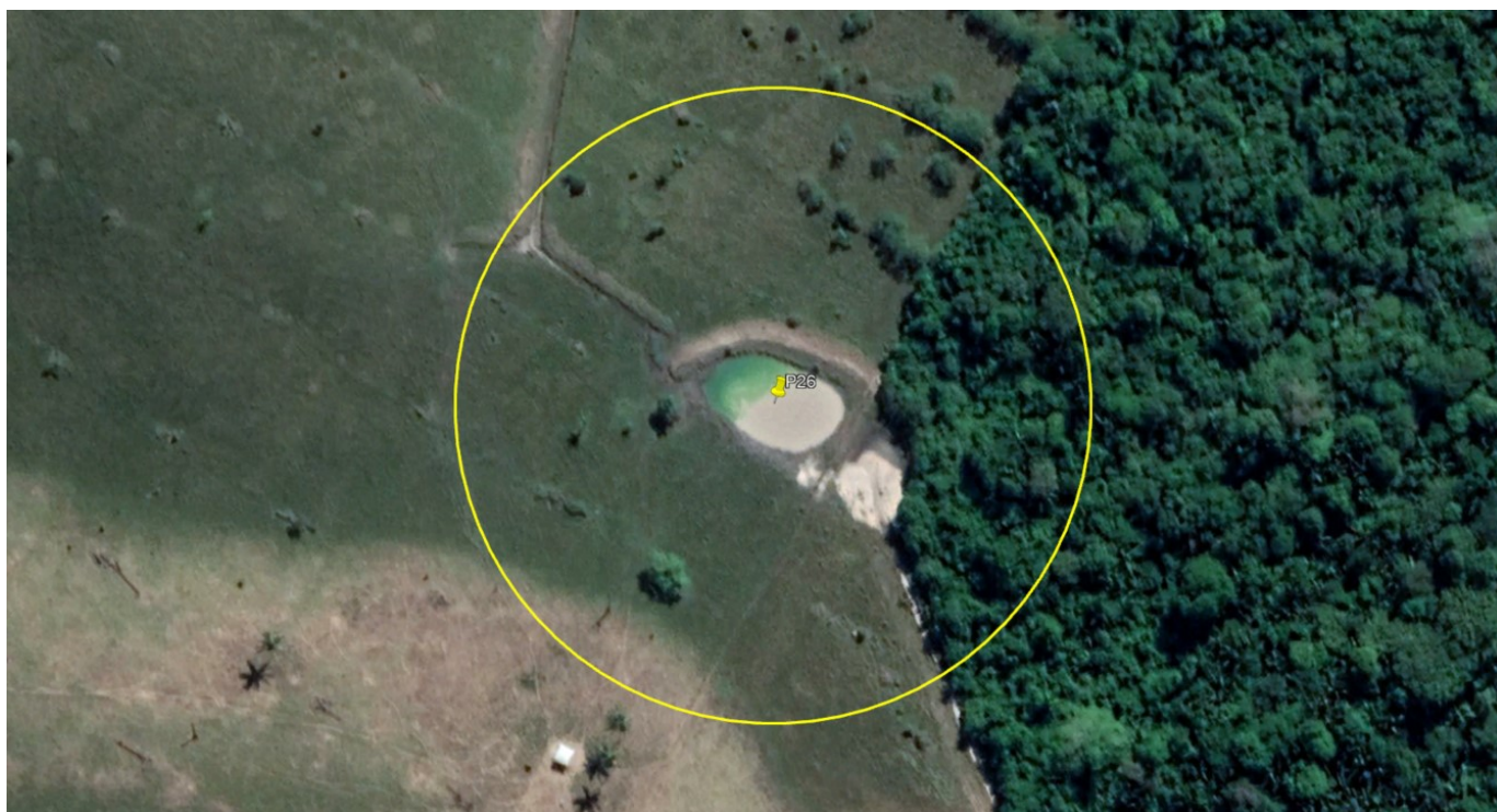
P26 – AÇUDE