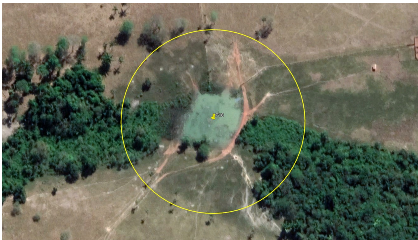
P16 – LAGO