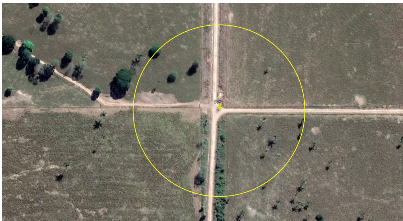
P22 – CRUZAMENTO