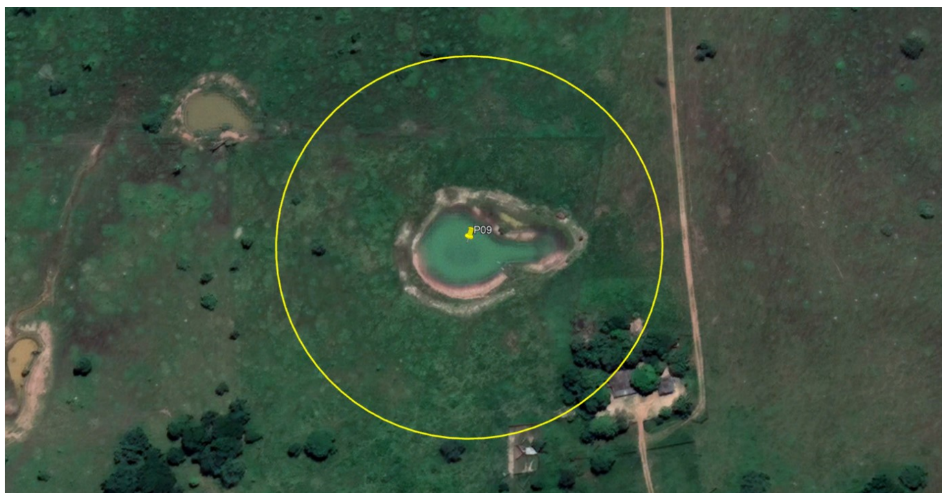
P09 – LAGO