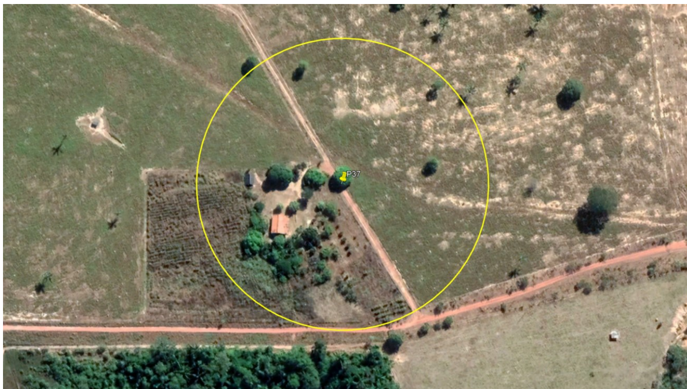
P37 – ÁRVORE