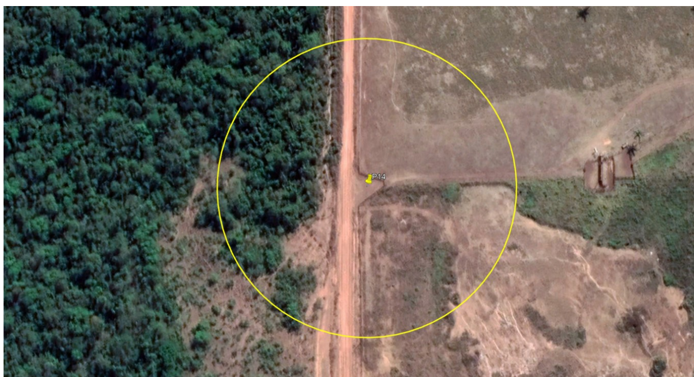
P14 – ENTRADA FAZENDA