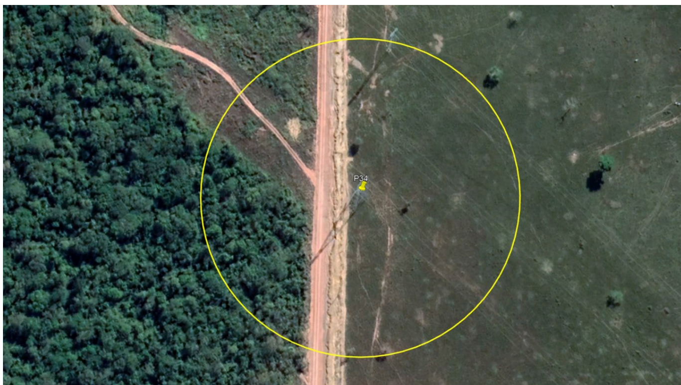
P34 – TORRE ALTA TENSÃO