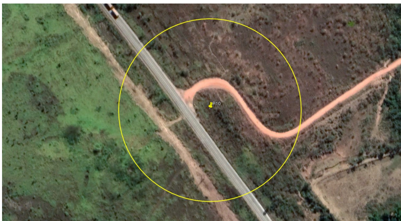
P10 – CURVA