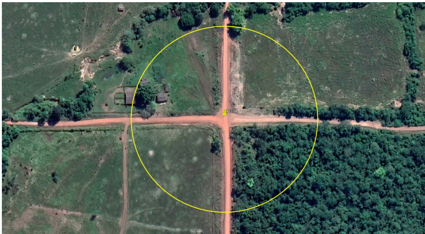
P39 – CRUZAMENTO