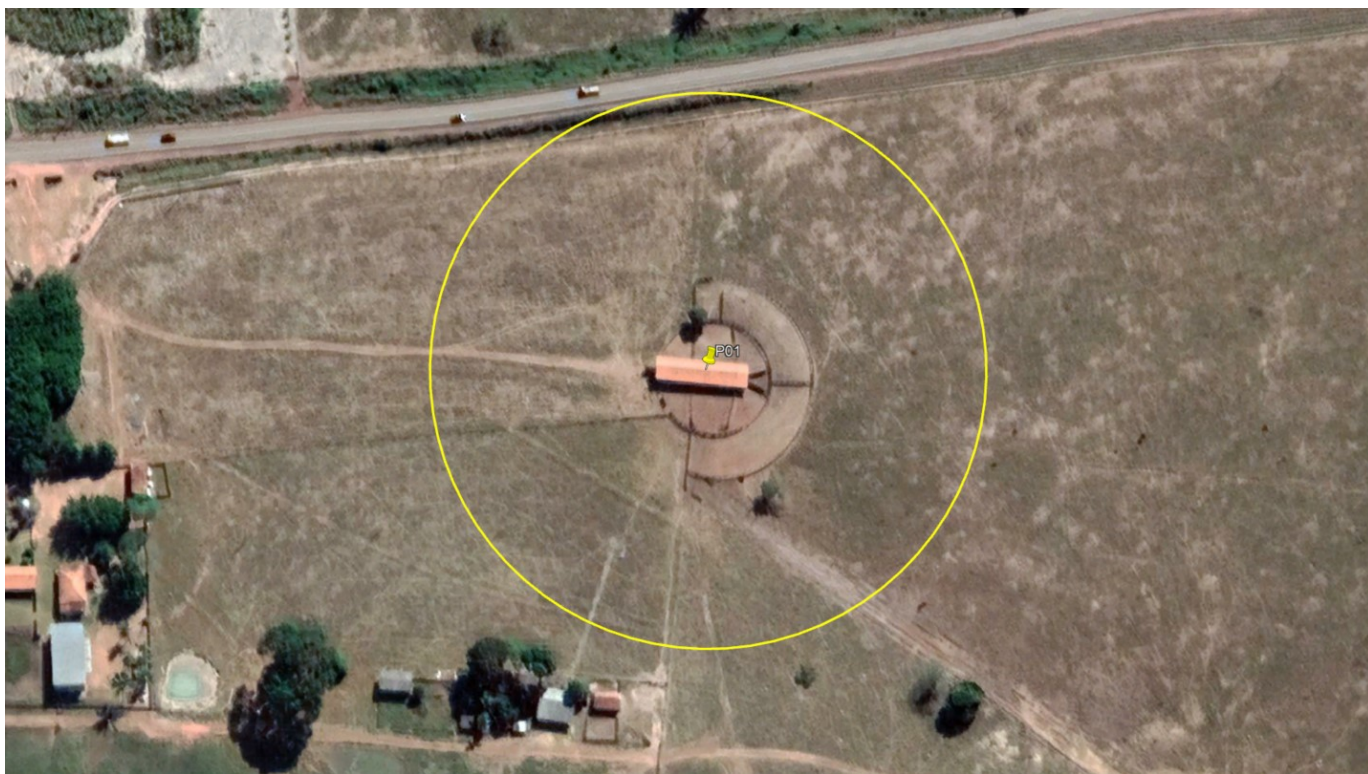
P01 – CURRAL