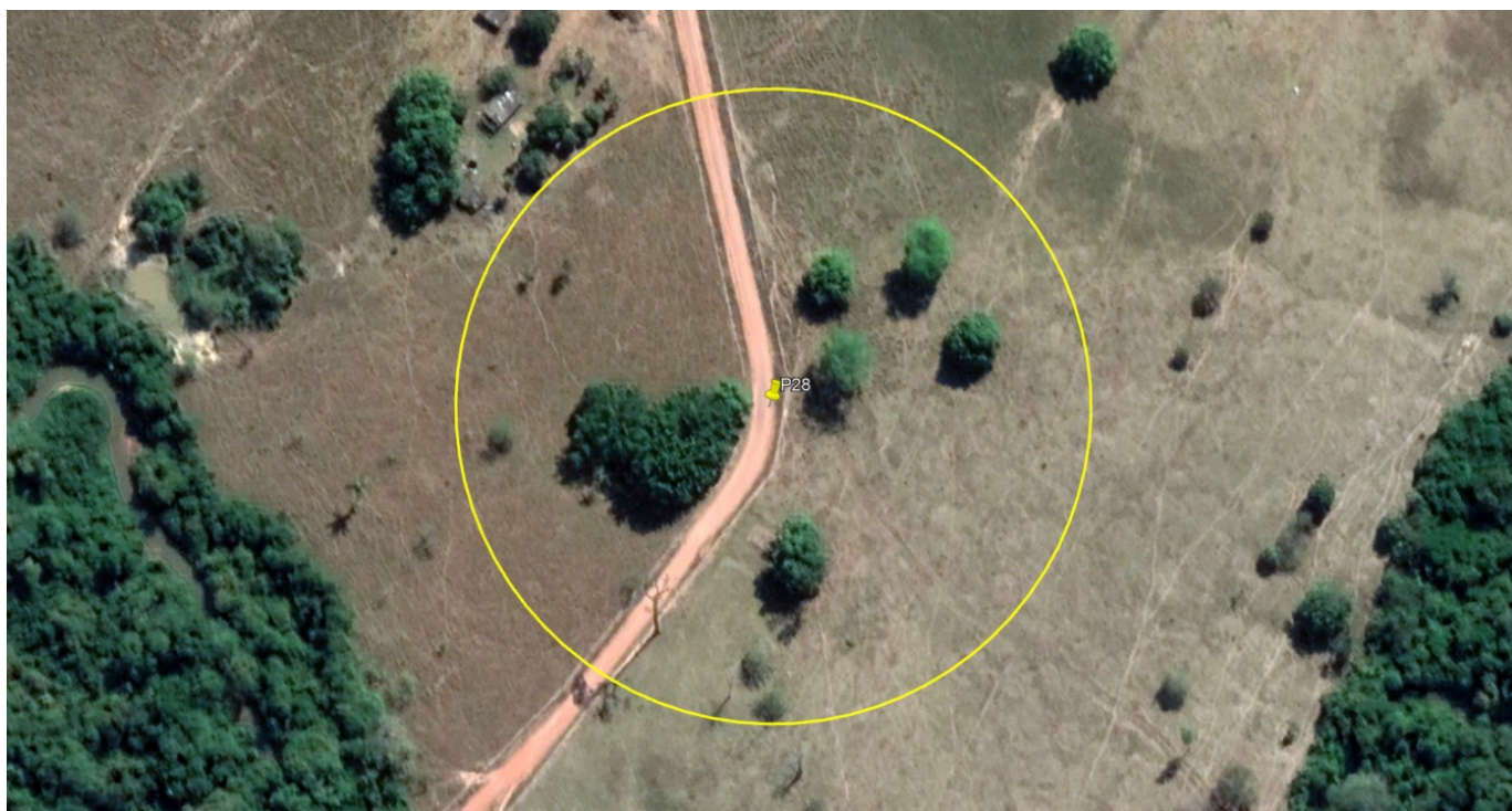
P28 – CURVA