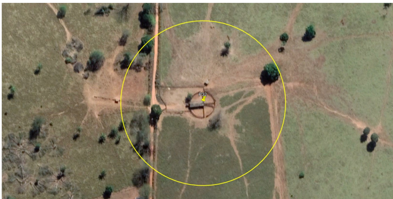
P32 – CURRAL