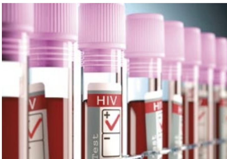
Os dados constam em um novo relatório global sobre Aids

à Aids requer colaboração entre o Sul e o Norte globais, governos e comunidades, ONU e estados-membros atuando conjuntamente. Exige uma liderança corajosa. O mapa apresentado neste relatório mostra como o sucesso é possível nesta década, mas apenas se avan-