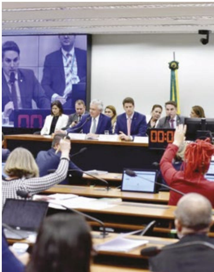
CPI que investiga MST é marcada por discussões entre parlamentares

Na tentativa de se defender, Salles alegou que as falas das deputadas precisavam ficar registradas por sempre tentarem se vitimizar. Girão chegou a