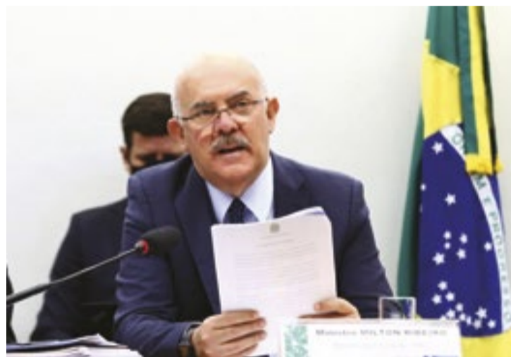
Aliado de Bolsonaro, Milton Ribeiro foi preso em sua residência

do em março de 2022, uma semana depois de a Folha de S.Paulo revelar áudio em que Ribeiro falava em priorizar pedidos dos pastores a mando de Bolsonaro.